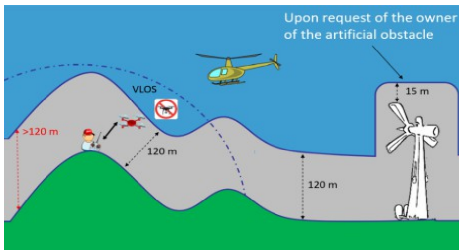
Figura 1: Alturas máximas operativas.

Para realizar operaciones clasificadas como "Specific", es necesario obtener de la autoridad nacional competente un documento de aprobación, cuya expedición está supeditada a la presentación por el operador de una declaración que contenga principalmente: