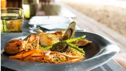
Imagen 4. Gastronomía del Hotel Boutique Ángeles de Paz