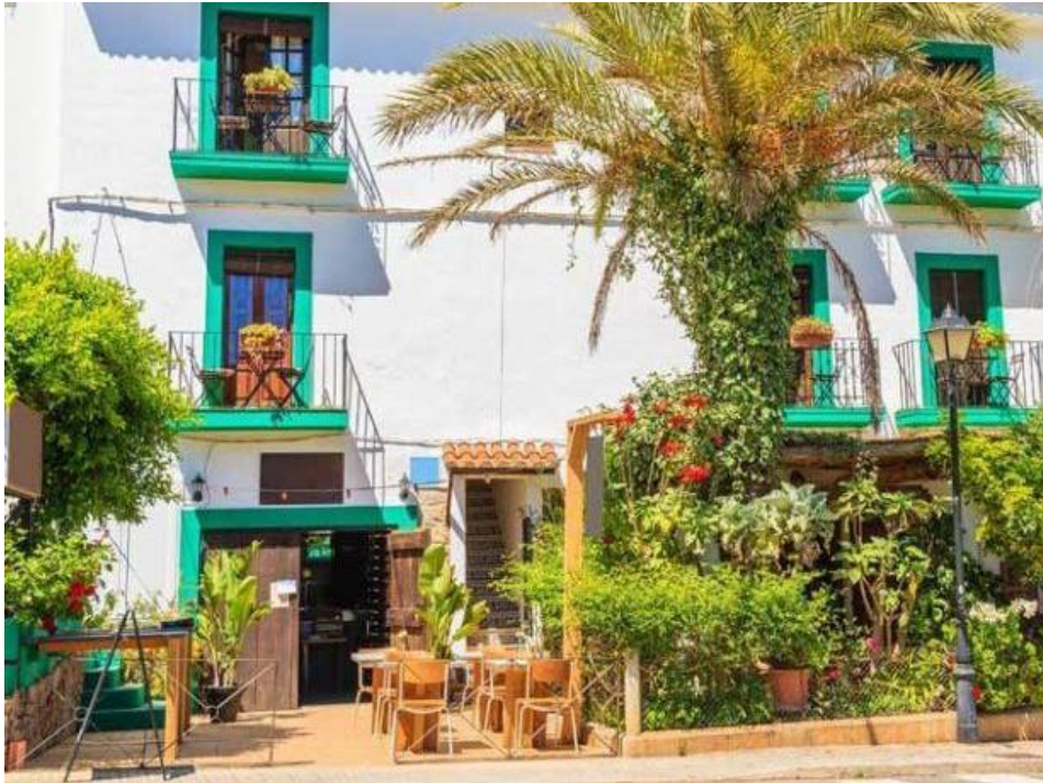
Imagen 3. Edificio Hotel Boutique Ángeles de Paz

Los canales de comercialización serán propias y de terceros. Principalmente las reservas se realizarán a través de nuestra propia página web ( https://hotelboutiqueanegelesdepaz.com ) e incluirán "réservation en ligne" a través de plataformas y la promoción en redes sociales y sitios web especializados en viajes y turismo, como Booking, TripAdvisor, Hotels, Instagram, Airbnb, Expedia e Instagram usados para compartir fotos y recomendaciones de viajes por los huéspedes y turistas. Los clientes también podrán realizar sus reservas, resolver sus inquietudes, proponer sugerencias y trasladar quejas a través del teléfono y correo electrónico habilitados para ello: +34971510213 / hotelboutiqueanegelesdepaz@gmail.com . La respuesta se dará en un plazo máximo de 30 minutos y el servicio de atención al cliente será de 24 horas, en español, inglés, francés, alemán o italiano.