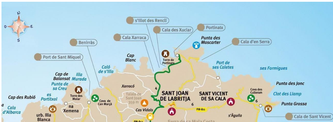
Imagen 1. Mapa Sant Joan De Labritja (Ibiza, España)