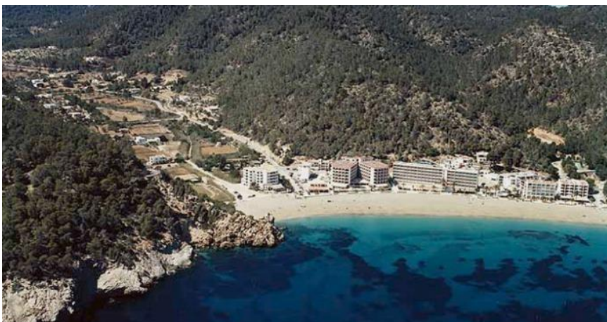
Imagen 2. Pueblo Sant Joan De Labritja (Ibiza)

Este pueblo tiene una altitud de 189,9139 metros y sus coordenadas geográficas son 1.5107783675193787 / 39.0780086063126. Sus municipios vecinos son los pueblos de Santa Eulària del Río, Eivissa, Sant Antoni de Portmany y Sant Josep de sa Talaia [3].